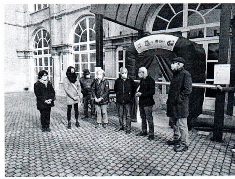
Inaugurazione a Vigone

Due stanze per far rincontrare parenti e ospiti sono state consegnate oggi a Vigone e Prarostino e saranno itineranti tra pianura e valli