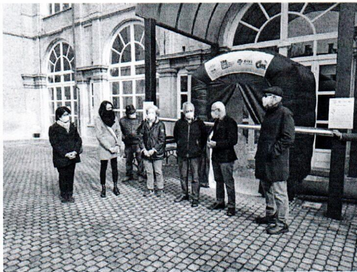
Inaugurazione a Vigone

Due stanze per far incontrare parenti e ospiti sono state consegnate oggi a Vigone e Prarostino e saranno itineranti tra pianura e valli