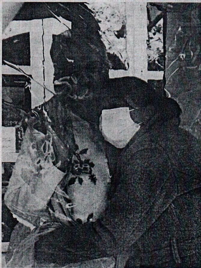
La Stanza degli abbracci "donata" a 12 RSA da Società Mutua Piemonte e dalle categorie dei pensionati di Cgil, Cisl e Uil.