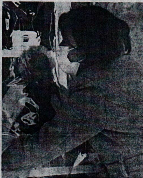
L'inaugurazione della Stanza degli abbracci presso la residenza "Castelli Fasolo" di Vigone.